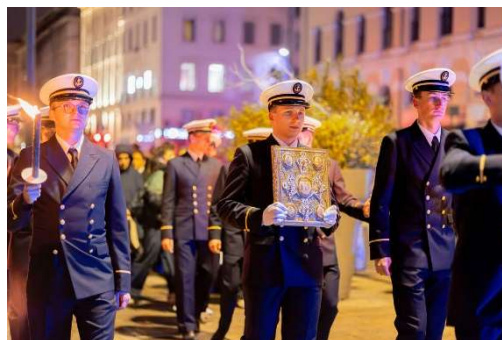
L'Évangile porté par les élèves de l'Hydro