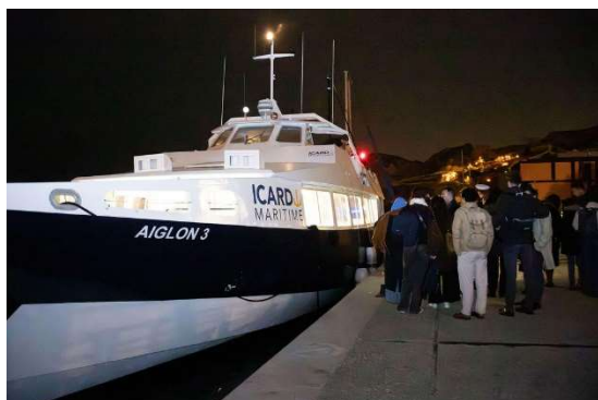
Arrivée du bateau école de l'Hydro

Déjà évoqué dans notre dernière lettre d'information, nous revenons avec quelques photos de cette fête populaire, organisée le 2 février, avec l'aumônerie de l'École, de la Marine Marchande, pour faire mémoire de l'arrivée de l'Évangile par la mer, à Marseille, apporté, selon la tradition, par les trois saintes Marie, parmi les premiers chrétiens, disciples du Christ